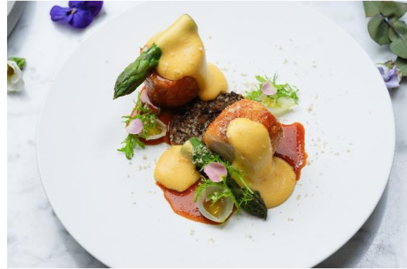
スロークックしたホロホロ鳥の胸肉とグリーンアスパラガス モリーユ茸のデュクセル オランダーズソース ヘーゼルナッツの香り