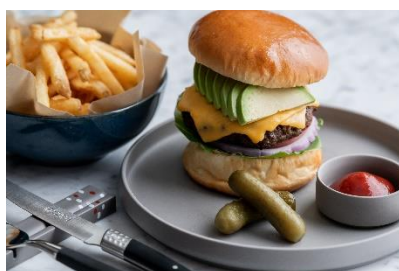
能登ビーフグリルバーガー