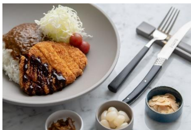
ビーフカレー金沢スタイル