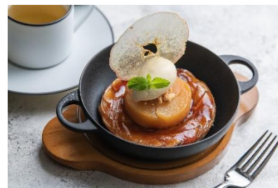
自家製アップルパイ