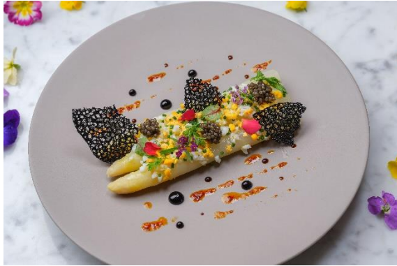
ホワイトアスパラガスのサラダ ミモザスタイル 竹炭チュイル シブレット キャビア マイクロサラダ

定番のランチコース「3 Course Lunch Plus」を期間限定で旬のアスパラガスづくしでご提供いたします。ゆったりとした空間で春を感じてみてはいかがでしょうか。