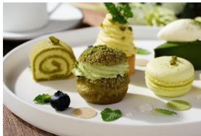
抹茶シュークリーム

北海道産のクリームチーズをたっぷりと使用したチーズケーキに抹茶を合わせました。クリームチーズの濃厚ながらも爽やかな味わいと抹茶の苦味と旨みがマッチし、多様な味わいがお楽しみいただける一品です。