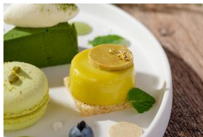
ピスタチオムース

ピスタチオを混ぜて焼き上げたマカロンに、濃厚なピスタチオバタークリームをサンド。珠洲の塩を使用し味を引き締め、奥深い味わいに仕上げました。