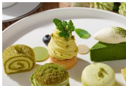
ピスタチオタルト

ピスタチオをたっぷり入れたリッチな生地に、能登の伝統野菜である中島菜を混ぜ、鮮やかなグリーンカラーに仕上げました。ピスタチオペーストを使用したホイップクリームを巻き上げ、しっとりとした生地と香り豊かな濃厚なクリームをお楽しみいただけます。