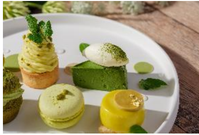
抹茶チーズケーキ

北海道産のクリームチーズをたっぷりと使用したチーズケーキに抹茶を合わせました。クリームチーズの濃厚ながらも爽やかな味わいと抹茶の苦味と旨みがマッチし、多様な味わいがお楽しみいただける一品です。