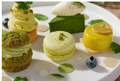
ピスタチオマカロン

サクサクに焼き上げたシュークリーム生地に、濃厚な抹茶カスタードと抹茶のホイップクリームをたっぷりと詰めました。