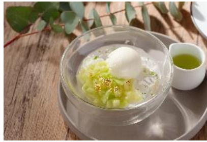
珠洲の塩ミルクソルベとメロン

パンナコッタの上に、フレッシュのメロンとミントのグラニテをトッピングし、塩ミルクソルベを乗せました。最後にお客様自らがメロンソースをかけていただく、爽やかな初夏にぴったりなさっぱりとした味わいのスイーツです。