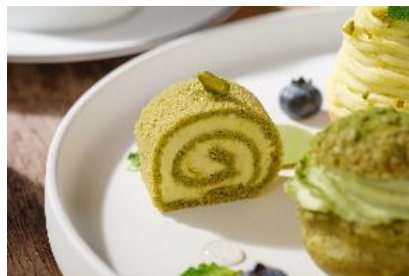
ピスタチオロールケーキ

豊かなコクと栄養価の高さから“ナッツの女王”と称されるピスタチオと、風味豊かな抹茶を贅沢に味わう初夏の新緑をイメージしたアフタヌーンティーです。グリーンカラーに統一された爽やかな見た目はもちろん、コクや香り、苦味など様々な味わいがお楽しみいただけるラインナップをご用意いたしました。多くの生き物を育む栄養豊富な能登半島の海から作られる珠洲の塩や、能登の伝統野菜である中島菜など、こだわりの石川県食材も贅沢に使用しています。