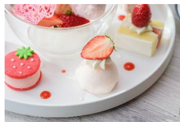
求肥のパルフェ包み