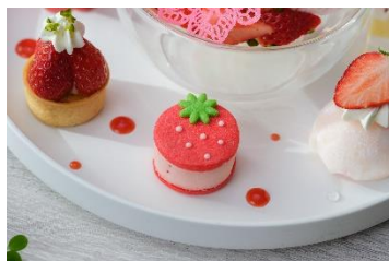
アイスサンドクッキー