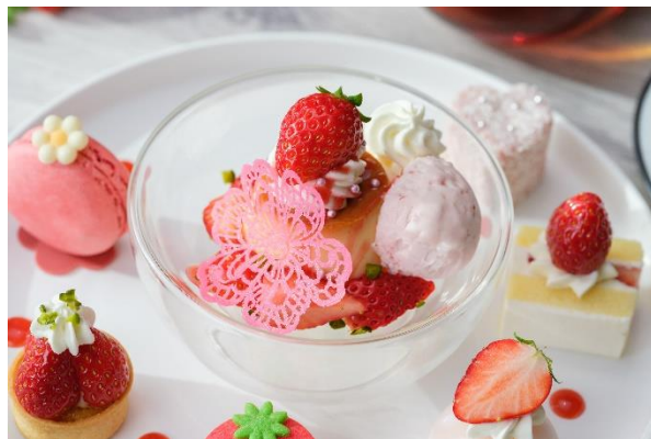
プリン・ア・ラ・モード

苺好きにはたまらない苺尽くしのケーキセットで、心弾むティータイムをお楽しみください。