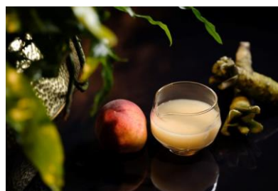
One Full Circle Zero Experience