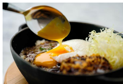
鉄なべ焼きチーズカレー