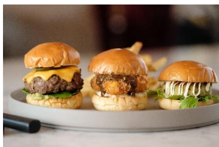
3種のスライダーバーガーとフレンチフライ

1周年を記念したアラカルトメニューも期間限定で提供いたします。芳醇な能登の大地から採れた食材を贅沢に使ったハイアット セントリック 金沢ならではの一品です。