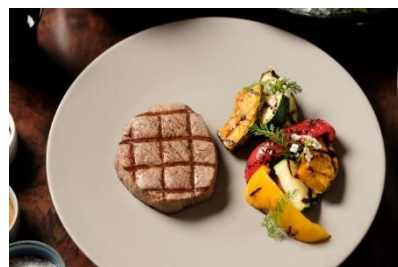
US テンダーロインと能登野菜の グリル能登コンディメント