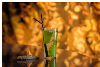
One Full Circle

夏風を感じながらRoofTerrace Barでサスティナブルなドリンクをお楽しみください。