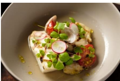
能登河豚と真鯛のアクアパッツァ 能登野菜とプチトマト添え