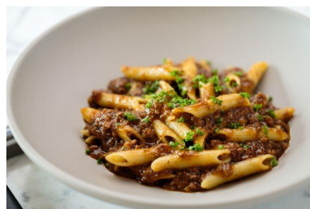
ペンネ/能登牛のミートソース