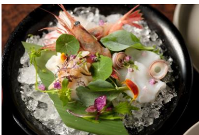
海の幸の盛り合わせ