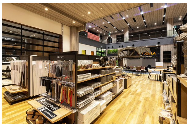
店舗1階ではギア専門店として約300種の豊富な商品が並ぶ

ショールームが複層階となる店舗の特徴を活かし、スノーピークのキャンプ用品などを取り扱う専門スペースを2つのゾーンに分けて展開。オリジナル什器を中心とした新築とは異なる条件での開業は、『ショップ イン ショップ』の特徴を上手く活用した、既存のお客様にも受け入れられながら、新たなお客様との接点が期待できるカタチだと考えます。