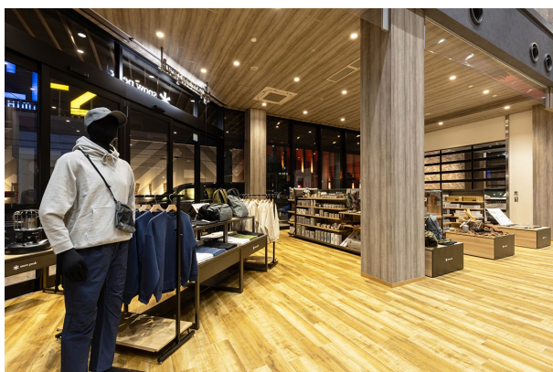
季節ごとに入替るスノーピーク限定アパレル商品の取扱いも行う