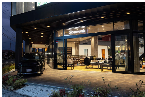
前面道路側には直営店と同様に専用の内照式看板を設置