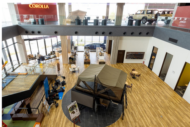
店内では吹抜けを介し、2層にわたって『ショップ イン ショップ』を展開