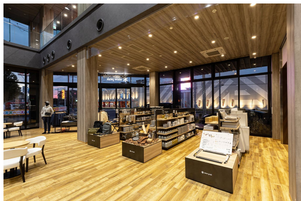
近江八幡店の一部を利用してショップ イン ショップを新たに開業、吹抜け部分にはフィールドトレーラーの展示も行う