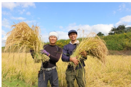
<有機米づくりに取り組む農家さん>