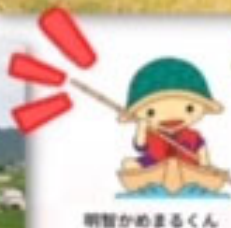
明智かめまるくん