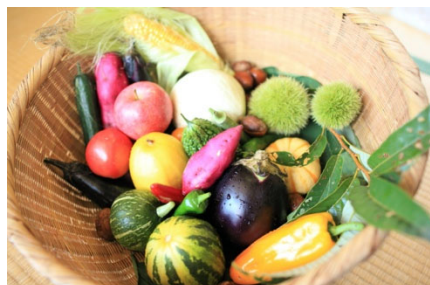
<新鮮でおいしい京野菜>