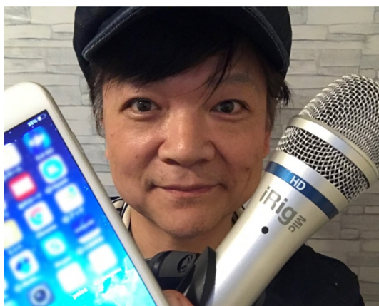
<提携ナレーター：木村匡也>