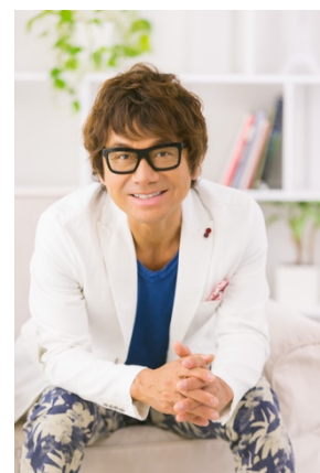
<提携ナレーター：伊津野亮>