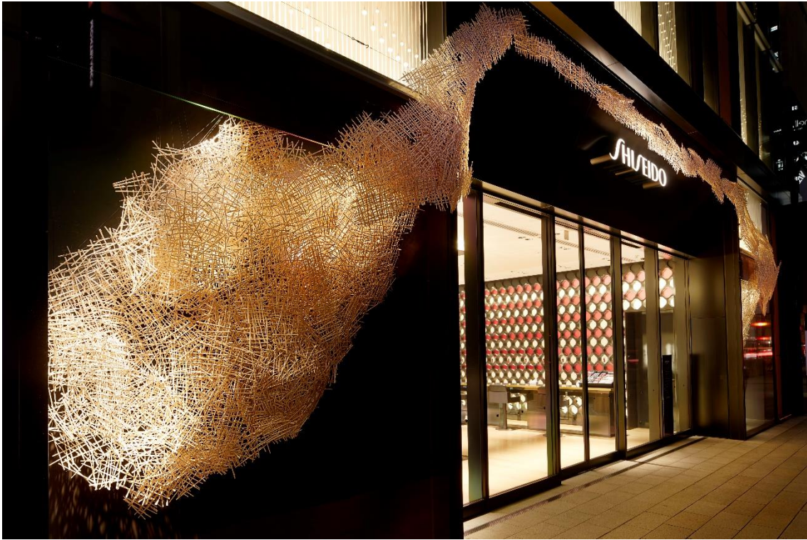
外にダイナミックに張り出したような視角効果を生むインスタレーション