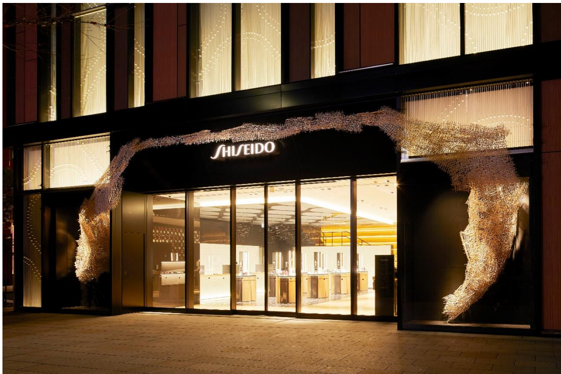
銀座中央通りファサード

資生堂の総合美容施設「SHISEIDO THE STORE」（東京都中央区銀座 7-8-10）は、東京が大きく変わる 2020 年、新たな試みに挑戦します。現代美術家とともに制作する 1 階ウィンドウギャラリーでは、2020 年の幕開けを担う作家として、世界的に活躍する川俣正氏を起用しました。