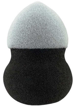
フロッキー3D スポンジ ハーフ