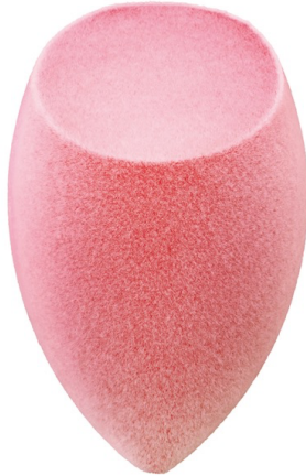
フロッキー3D スポンジ