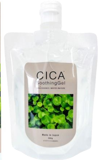
(販売名:PT スーzingジェル C <ボディジェル>)