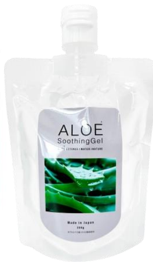
(販売名:PT スーzingジェル A <ボディジェル>)