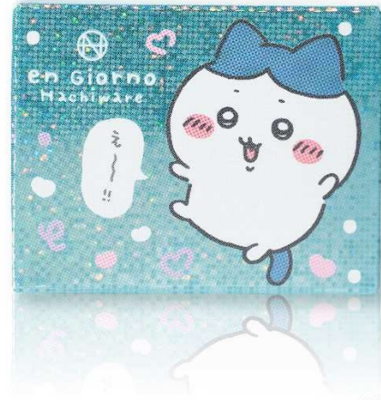
enagano / chikawa committee