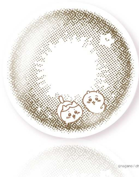
enagano / chikawa committee