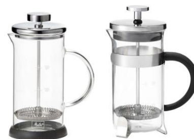
スタンダード プレミアム

製品名 : メリタ フレンチプレス スタンダード/プレミアム 型番 : スタンダード MJF-1701、プレミアム MJF-1702 販売開始時期 : 2017年5月下旬 価格 : スタンダード 2,000円、プレミアム 2,500円 本体サイズ : スタンダード/プレミアム W130*L74*H160mm 本体重量 : 0.3kg 最大容量 : 350mL URL : http://www.melitta.co.jp/personal/frenchpress/mjf.html