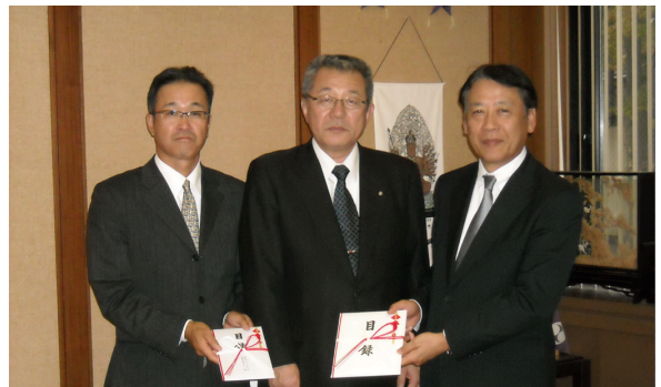
野田村トラストワン寄贈式典

LED ソーラー灯の最大の利点は電気の供給が無くても周囲を明るく照らす事が出来ることです。今回寄贈する LED ソーラー灯が被害を大きく受けた東北沿岸部の地域を明るく照らし、東北沿岸部の早期復興の為に活躍してくれることを期待すると共に、被災地の一日も早い復興を心よりお祈り申し上げます。