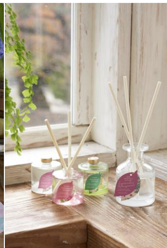
3. LIVING ITEMS