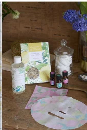
2. BATH & BEAUTY