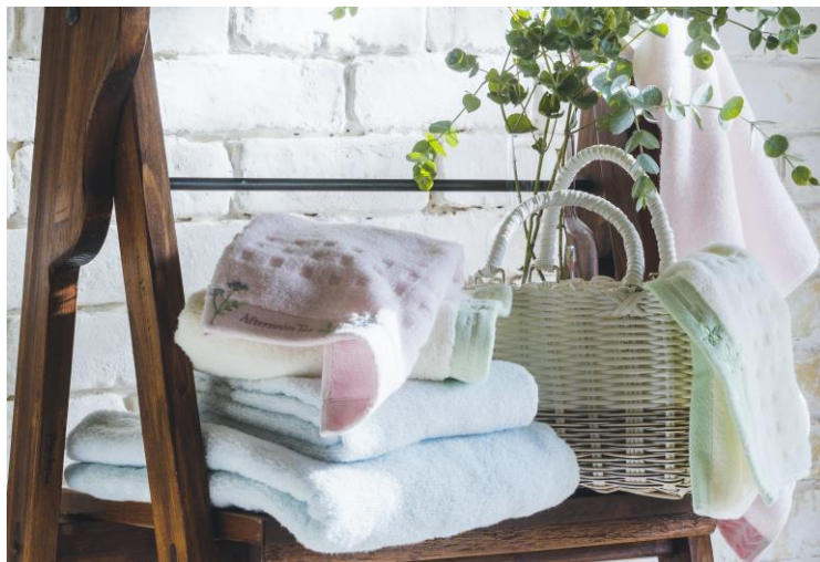
1. ハイドロ銀チタン®タオルシリーズ