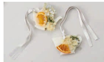
ワックスバー2個セット(BOX入り)¥4,200