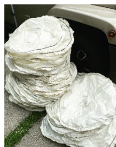
再生利用前のエアバッグ