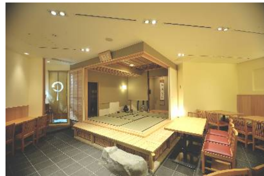
禅カフェ「坐月 一葉」

匠の方達のご協力で「本物」の茶室が完成いたしました。その「本物」が醸し出す落ち着いた空間の中、喫茶・イベントをお楽しみ下さい。