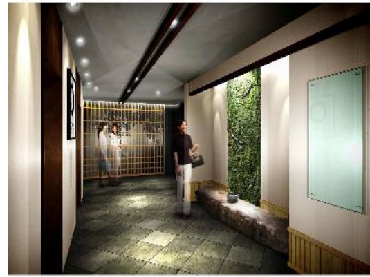
6階エレベーターホールイメージ