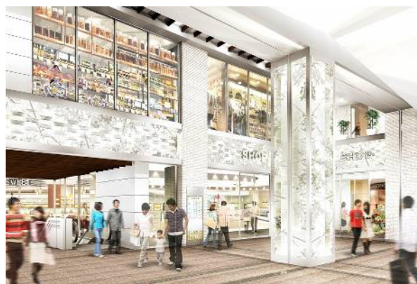
2階正面入口イメージ