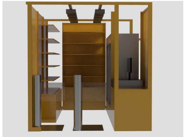
TTG-SENSE MICRO イメージ