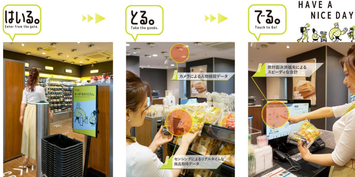
<ご利用の流れ（他社事例）>

展開に加え、病院、ガソリンスタンド、工場等の共用部・休憩室などでも事業展開を可能にし、事業者、お客さまの双方に利便性を提供できる新たなソリューションとなっています。