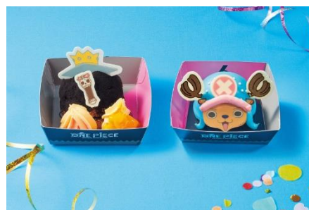
(左) ♪ ブルックのマンゴー&ココアシュークリーム♪ (右) ♪ チョッパーのレモンムース♪