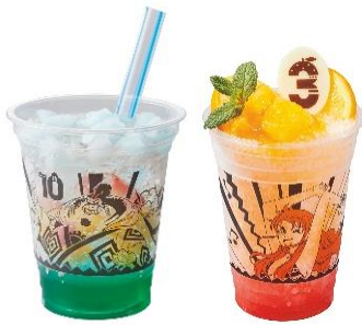
(左) ♪ 操舵手ジンベエの海色ソーダ♪ (右) ♪ ナミのオレンジフラッペ♪

今年は、気軽に立ち寄れるスナック・スタンドや、フードカートで手に入る食べ歩きメニューも充実。『フォッシル・フュエルズ』（ジュラシック・パーク内）では、「ロビン」に続き、史上初めての展開となる「ジンベエ」をテーマにしたメニューが登場します。海の色が爽やかな「操舵手ジンベエの海色ソーダ♪」、「ナミ」の大好きなオレンジをふんだんに使った「ナミのオレンジフラッペ♪」、「フランキー」をイメージしたソーセージとポテトが入った「フランキーのスーパー〜!!!アメリカンホットドッグ♪」と、ユニバーサル・スタジオ・ジャパンのアレンジを加えた、ユニークで SNS 映え間違いなしのオリジナル・フード&ドリンクを満喫いただけます。また、ロストワールド・レストラン横の『ワンピース・フードカート』では、ピリッとスパイスの効いた「サンジの悪魔（ディアブル）ソース・ポークリブ♪」、『ロンバーズ・ランディングのテラス』では、ハートをあふれんばかりにトッピングした「サンジのメロリン♡フロズン・スムージー ~ピーチ&レモン~」など、「サンジ」のスペシャルメニューを存分に味わうことができます。