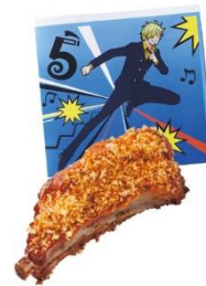
♪ サンジの悪魔(ディアブル) ソース・ポークリブ♪