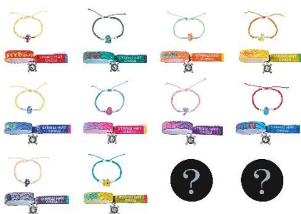
コレクタブルブレスレット