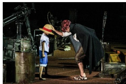
※画像は過去のものです