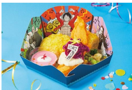
♪ ロビンのハナハナ・フィッシュフライプレート♪