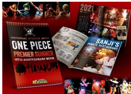
(左)ワンピース・サマー宴(フェス)・レストランのメニュー (右上)フォッシル・フェルズのメニュー (右下)15周年アニバーサリーブック(イメージ)

今夏の限定フード&グッズは、劇場版最新作「ONE PIECE FILM RED」(2022年8月6日(土)公開予定)と連動する、“音楽フェス”をテーマにしたラインナップとなります。