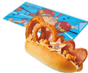
♪ フランキーのスーパー〜!!! アメリカンホットドッグ♪