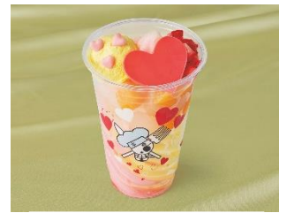
サンジのメロリン♡ フロズン・スムージー ~ピーチ&レモン~