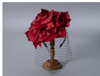
ヘッドアクセサリ