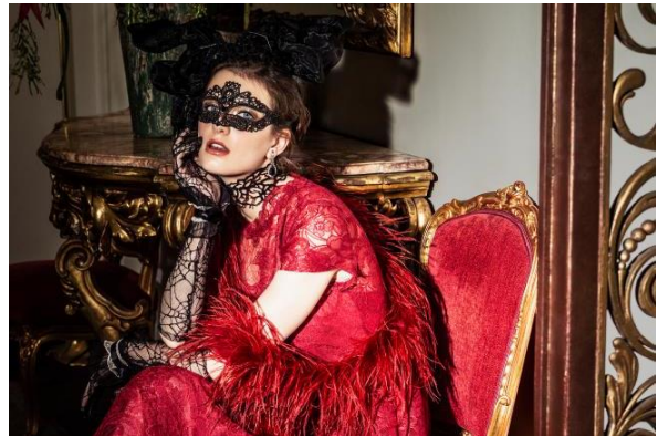
モデル着用貸出グッズ： ボレロ(ファー)、グローブ