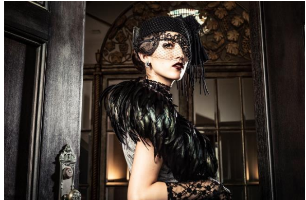
モデル着用貸出グッズ： ヘッドアクセサリー、ボレロ、グローブ