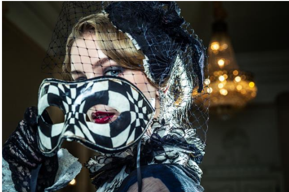
モデル着用貸出グッズ： ヘッドアクセサリー、マスク