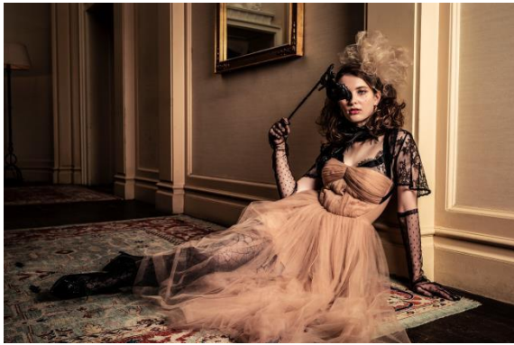
モデル着用貸出グッズ：マスク、ボレロ