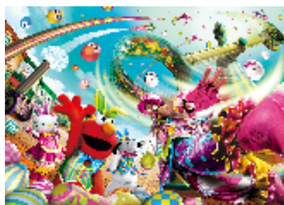
ユニバーサル・イースター・ セレブレーション