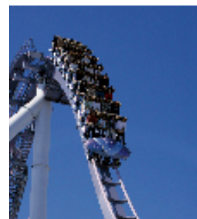
ハリウッド・ドリーム・ザ・ライド