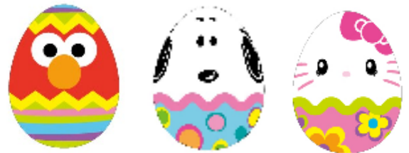
「エッグ・ハント・ラリー」プレゼント：特製イースター・エッグ （オリジナルカンバჯ入り） *イメージ

1周年を迎えた「ユニバーサル・ワンダーランド」などパーク内各所で、西欧で春の象徴とされるイースター（復活祭）をテーマに、花が咲き若葉芽生える春ならではの、カラフルで摩訶不思議な色のデコレーションが飾られ、この時期しか会えない“イースターバニー”に扮した愛らしいキャラクターたちが登場します。また、お子さまたちの本格的な異文化体験デビューとなる、イースターの風物詩“エッグ・ハント”を開催。「エッグ・ハント・ラリー」（有料・お一人様500円）で、イースターバニーになったエルモやスヌーピー、ハローキティたちが隠したかわいらしい“イースターエッグ”を見つけ出すと、イースターにちなんだ特別なプレゼントがもらえます。ご家族皆様でパークを巡りながら、イースターエッグを見つけた瞬間のお子さまの達成感あふれる笑顔、かわいらしいデコレーションとともに記念写真に収めてください。ほかにも、「ユニバーサル・ワンダーランド」では、小さなお子さま向けに、キャラクターたちとカラフルなイースターエッグで楽しむ遊びや、キュートな春色のメニュー、イースターをモチーフにしたかわいいグッズが登場したりと、この時期だけのお楽しみが盛りだくさんです。