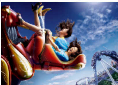
ハリウッド・ドリーム・ザ・ライド ~バックドロップ~

ユニバーサル・スタジオ・ジャパンと世界屈指のコースターメーカーの独創性と技術を結集し、数々の最先端機能を搭載した「ハリウッド・ドリーム・ザ・ライド」。スムーズでスリリング、空飛ぶ浮遊感で人気を博し続けている“新感覚コースター”に、ありえない角度で、後ろ向きで突き落とされる、絶体絶命・大絶叫バージョン【ハリウッド・ドリーム・ザ・ライド ~バックドロップ~】を期間限定で投入します。背中から突き上げられ、天を仰ぎながら後頭部から急降下、進路不明で予測不可能、極限のスリルと刺激が、何もかも吹き飛ばす究極の爽快感を生み出します。世界に誇る高品質・高性能コースターだからこそ実現したフォワード(前向き走行)とバックドロップ(後ろ向き走行)の同時運行はこの春だけ、期間限定の「大絶叫」体験です。