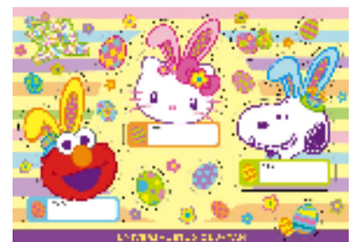
オリジナルお名前シール *イメージ

オフィシャルホテル（ホテル近鉄ユニバーサル・シティ、ホテル京阪 ユニバーサル・シティ、ホテル京阪 ユニバーサル・タワー、ホテル ユニバーサル ポート）に宿泊時、パークの「エッグ・ハント・