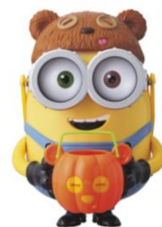
アソートスイーツ ¥2,800 (税込)