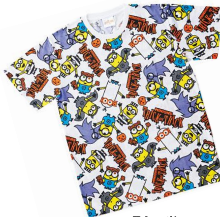
Tシャツ ¥3,700 (税込)

昼に開催するパレード『フェスタ・デ・パレード』に登場する、 仮装したキャラクターになりきれる‘なりきり’グッズが登場 。身に付けたら思わず踊りだしてしまいそうになるほど、ハロウィーンの仮装気分を盛り上げてくれるグッズです。今年は、ミニオンたちも仮装をしてパレードに参加します。そんな仮装したミニオンたちになりきることでできる、Tシャツやハットも登場。身に付けたら、注目されること間違いなし。気分も“ハチャメチャ”に！