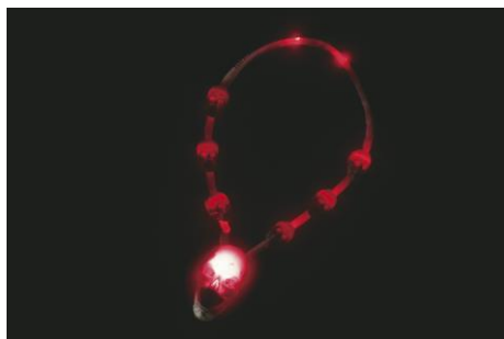
『ゾンビのエジキ』 ¥2,000 (税込)

また、身に付けるだけで更なる恐怖が襲いかかる『 ゾンビのエジキ 』が昨年に引き続き登場。今年は、新たに“ ガイコツ ”がモチーフとなり、 身につけるとたちまちゾンビの標的に 。パーク中に蠢くゾンビ達が、さらに襲い掛かります。その名の通り『 ゾンビのエジキ 』になって、さらにゾンビに襲われて大絶叫したいゲストは、身に付け必須のアイテムです。