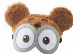
ハット ¥2,500 (税込)