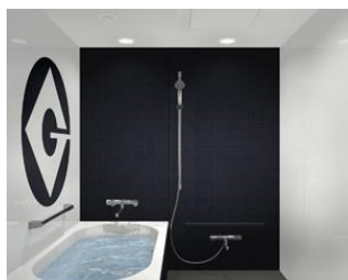
「世界一の悪党」を目指すグルーの趣味趣向満載のバスルーム