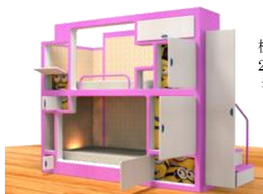
棚に見立てた2段ベッドにはミニオンがいっぱい