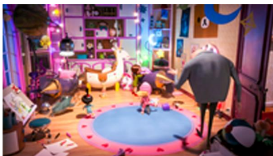
映画「怪盗グルーのミニオン危機一発」より

室内は、作中でアグネスが座っていた巨大“クマのチェア”や子どもたちのお部屋にある