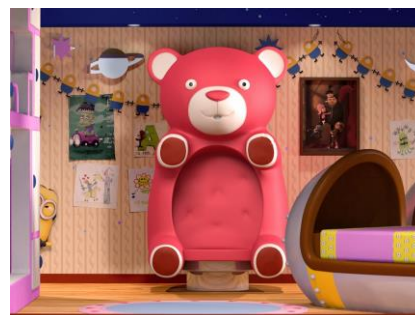
高さ約2m！ 大きすぎて、可愛いすぎるピンククマのチェアに座って、3姉妹の気分を楽しもう