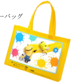
ランドリーバッグ