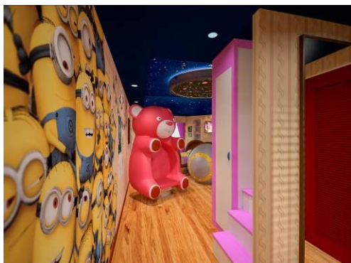
お部屋に入ると、ミニオンたちが興味深々ゲストをお出迎え！