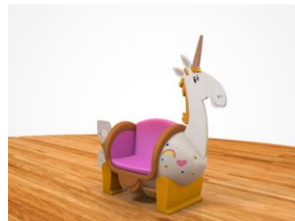
アグネスの大好きなユニコーンがソファになった！