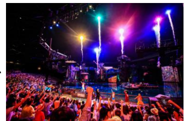
※写真は過去開催時のものです