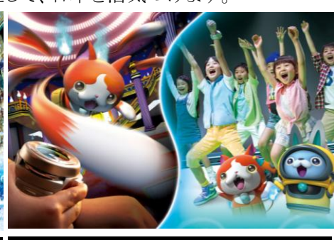
『ユニバーサル・ジャンプ・サマー』