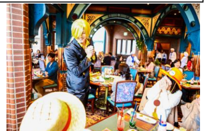
※写真は過去開催時のものです

麦わらの一味で料理人(コック)を務めるサンジが愛情を込めてプロデュースする『サンジの海賊レストラン』が、今年も「ロンバーズ・ランディング」にオープンします。今年“和”を取り入れた特別なフレンチで、ゲストを熱くお出迎え。さらにサンジが各テーブルを回ってあなたのために目の前でサーブするなど、かつてなく情熱的なおもてなしに思わずうっとりし、自分が物語の主人公になったかのような「特別感」に、心はもうときめきっぱなし。いつもとは違う意外な姿のサンジにも出会えるかも！