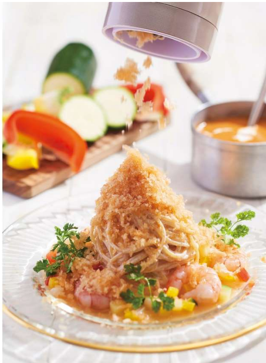
キハチ カフェ 日比谷シャンテ、アトレ浦和「スノーアイスパスタ～オマール海老のビスク風～」

キハチのシェフが得意の冷製パスタを進化させた「スノーアイスパスタ」。昨年、青山本店で登場し、人気メニューとなりました。今年は新作メニューを追加、開催店舗も3店舗に増やして展開します。