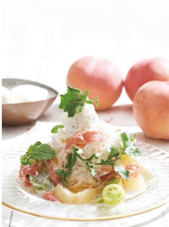
キハチ 青山本店「スノーアイスパスタ～桃と水牛のモッツァレラチーズと生ハムのヨーグルトソース～」

株式会社サザビーリーグ（本社：東京都渋谷区千駄ヶ谷／代表取締役社長 角田良太）が運営するキハチ 青山本店では、“かき氷”と“パスタ”を組み合わせた新感覚のひんやりフード「スノーアイスパスタ」新作1種、全3種を7月2日（月）から、キハチ カフェ 日比谷シャンテ、アトレ浦和では、「スノーアイスパスタ」新作1種を7月1日（日）からそれぞれ期間限定で発売します。