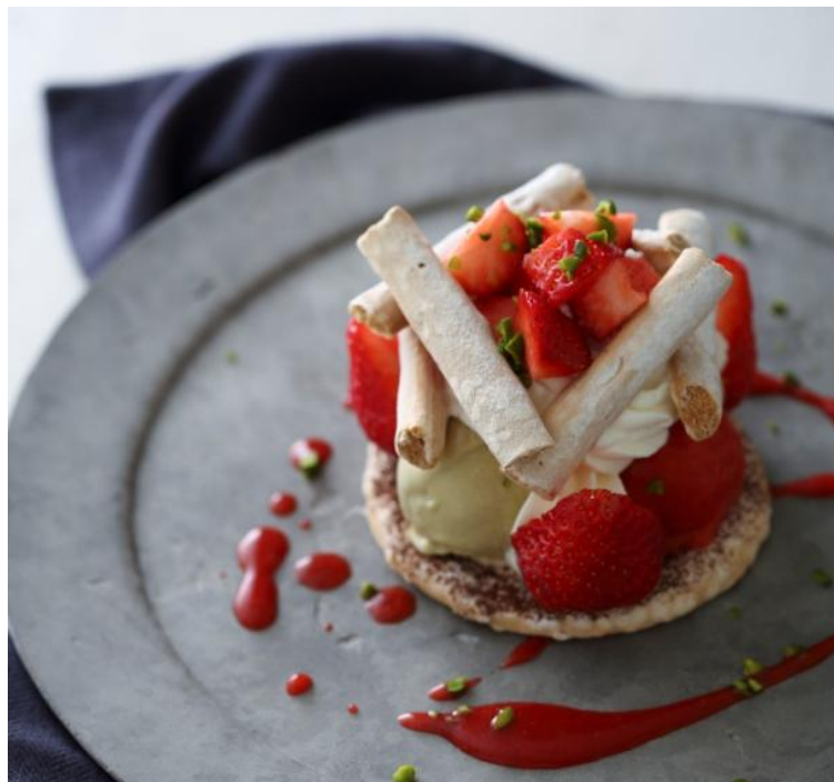
「福岡県産あまおう苺のバシュラン」

株式会社サザビーリーグ（本社：東京都渋谷区千駄ヶ谷／代表取締役社長 角田良太）が運営する“本物を知る大人の男性のためのカフェ”リジীগ（伊勢丹新宿店 メンズ館8F）では、フランス・サヴォワ地方発祥のスイーツをアレンジした「福岡県産あまおう苺のバシュラン」を4月1日（土）から4月30日（日）まで1ヶ月限定で発売します。