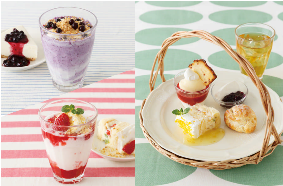
左：サマーデザートドリンク第1弾 右：初夏のアフタヌーンティーセット

アイビー株式会社（本社：東京都渋谷区、代表取締役社長：角田良太）は、4月23日（木）から、スイーツをイメージした夏限定のデザートドリンクを、全国のアフタヌーンティー・ティールームにて順次発売します。また、初夏限定のスイーツやフードメニューも登場します。