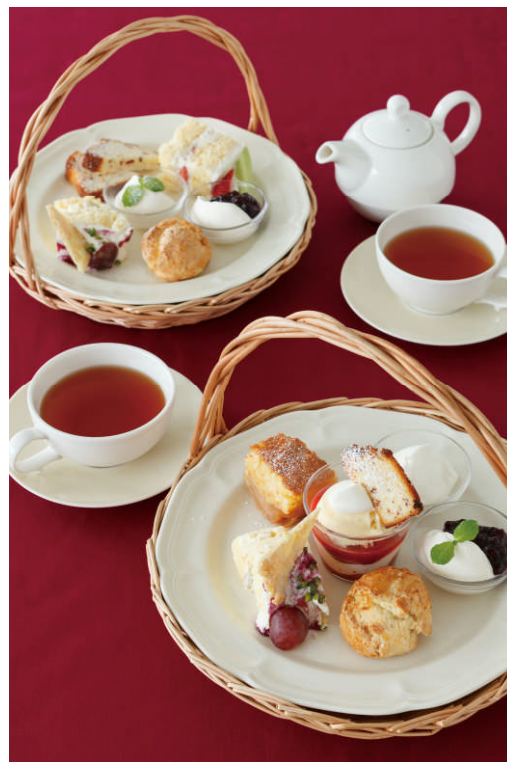
「アフタヌーンティーセット」平日限定プロモーション

夏の暑さもやわらぎ過ぎやすくなる秋、アフタヌーンティー・ティールームでは秋の実りを味わう限定メニューが登場するほか、女性に嬉しいプロモーション企画も実施します。こちらのプロモーションは、9月4日（木）～11月5日（水）の期間中、平日に限り「アフタヌーンティーセット」をふたたびご注文いただくと、通常お好きなお茶とスイーツ3種のところ、スイーツ4種をお選びいただけます。