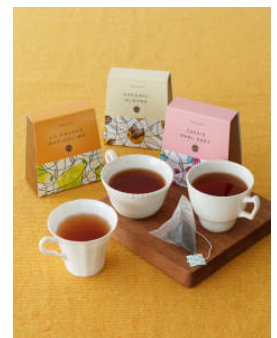
秋限定の紅茶3種類