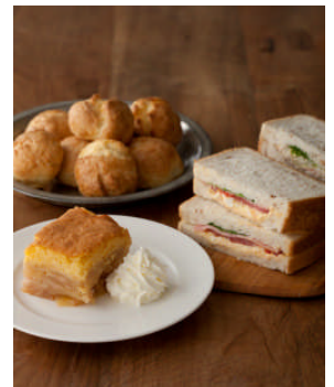
ティーパートナー

アフタヌーンティー・ティースタンド ららテラス 武蔵小杉 (4月19日オープン) アフタヌーンティー・ティースタンド イオンモール幕張新都心 アフタヌーンティー・ティースタンド表参道 アフタヌーンティー・ティースタンド イオンモール川口前川