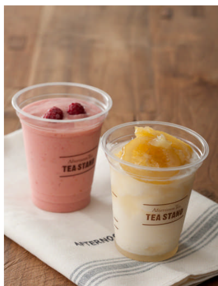
左：新作3種イメージ 右：フローズンスムージーイメージ

Fruits & Mojito ～フルーツやハーブは紅茶との相性がぴったり。素材の美味しさと清涼感を愉しんで～