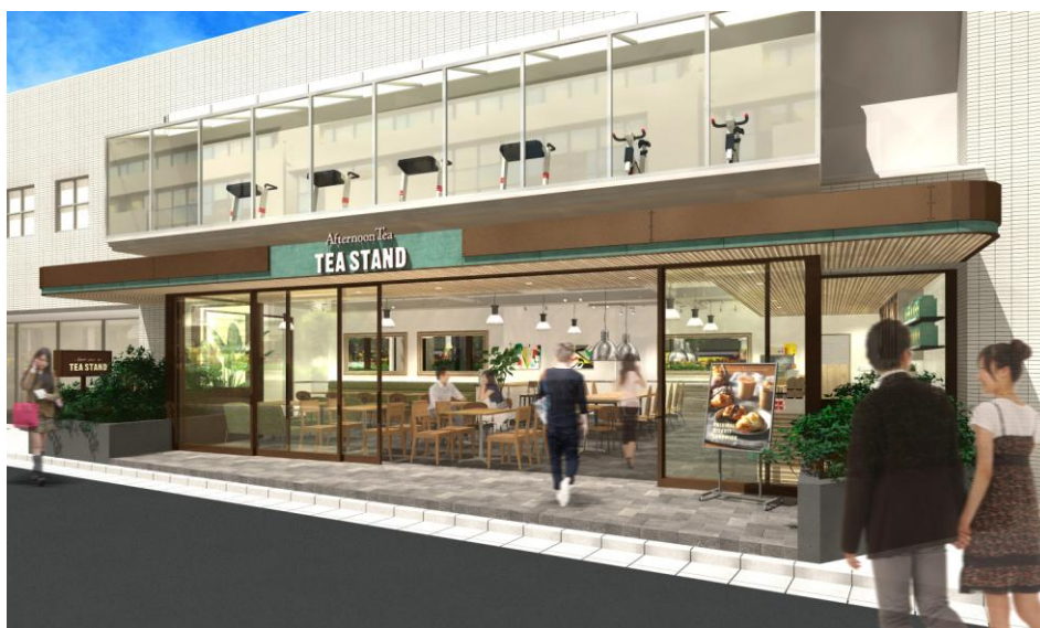
店舗外観イメージパース

<ホームページ> http://www.afternoon-tea.net <フェイスブック> http://www.facebook.com/afternoontea.jp <ツイッター> http://twitter.com/AfternoonTea_LT