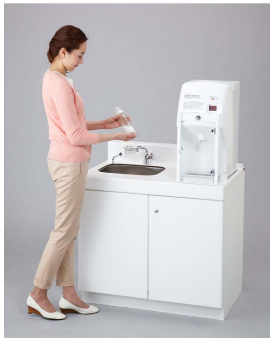
CH22-3 シンク一体タイプ

※70℃以上のガイドライン：『乳児用調製粉乳の安全な調乳、保存及び取扱いに関するガイドライン』（2007年6月 厚生労働省告示）