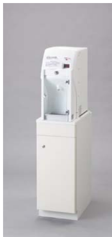
CH22-1/2 シンク併設用・単独タイプ