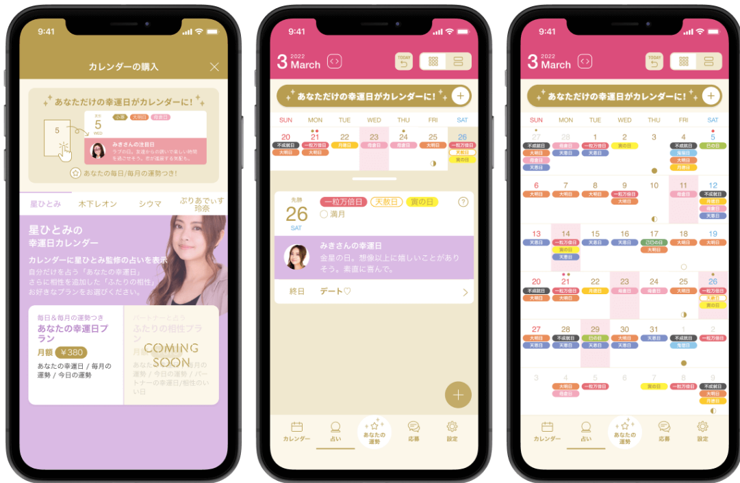
※アプリ内イメージ

あなただけの運がいい日に合わせて予定を書き込み “あなただけ”の開運カレンダーが完成！