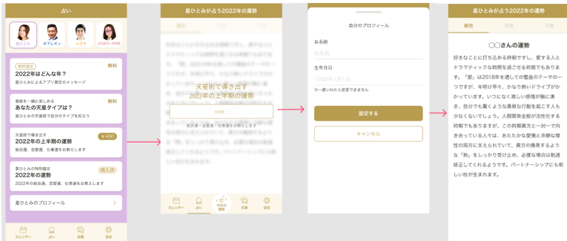
※アプリ内「占いメニュー」イメージ

■ 端末のカレンダーと同期もできる『運がいい日』がわかるカレンダー』 おススメの活用方法 『運がいい日』がわかるカレンダー』は、ひと目で「運がいい日」が確認できその意味を確認することができるので、「運がいい日」は何をするのにいい日なのかを具体的に理解して行動にうつすことができます。また、アプリ内のカレンダーカスタマイズのページからデフォルトのカレンダーと同期させることも可能です。