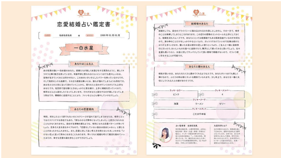
「恋愛結婚占い鑑定書」イメージ