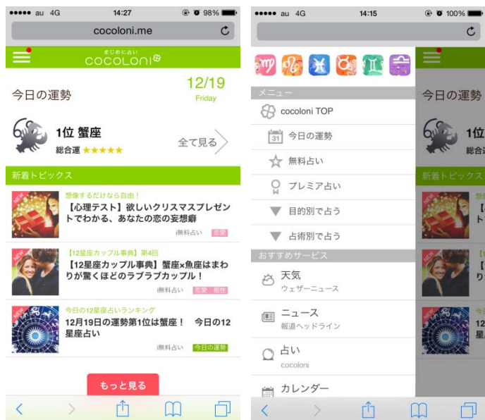
「cocoloni」トップページイメージ