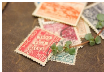
世界に目を向けて。南アジアや フェアトレードについて学ぶ