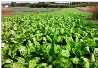
珍しい国産ザーサイの収穫で 最近話題の「農業女子」に

ソロの女性へ向けて、新たなトレンドを買える“体験専門店”「solomono(ソロモノ)」では、「ザーサイの収穫を楽しめる農業女子体験」や、「心を鎮めるお寺のお掃除&座禅体験」、「フェアトレードや社会貢献を学ぶ体験」、「春画を知る女性限定アートツアー」など、新たな体験を続々販売開始しています。気候も快適になり、集中力の高まる秋はまさに自分磨きにうってつけの季節ということで、大人の女性たちに心身ともに実り豊かに過ごしていただくためにソロモノならではのアイデアを詰め込んだ体験を取り揃えました。