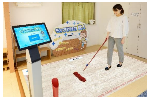
モップがけの達人