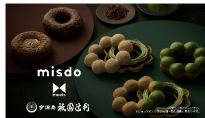
NA) ミスドミーツ 祇園辻利