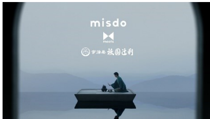
NA) ミスドミーツ 祇園辻利