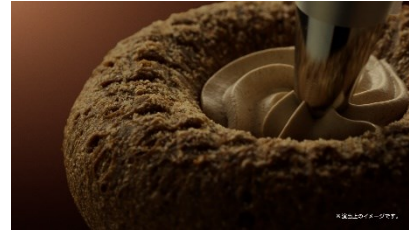
NA) ほうじ茶ホイップ!