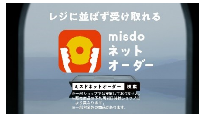
菅田さん OFF) ネットオーダーでも どうぞ。