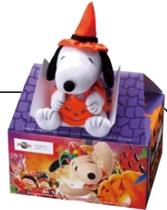
オリジナルボックス入り

【対象商品】ミスドハロウィーンドーナツ 6種、他人気商品5種 計11種類の中から合計7個を選択