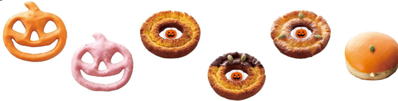
好きなドーナツ 7個