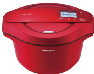
KN-HW24／6万6000円 ※現在は新機種（KN-HW24G）を販売