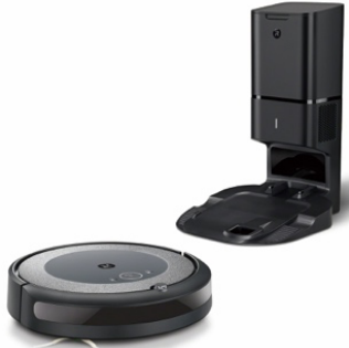
ルンバ i3+ / 9万 9800 円