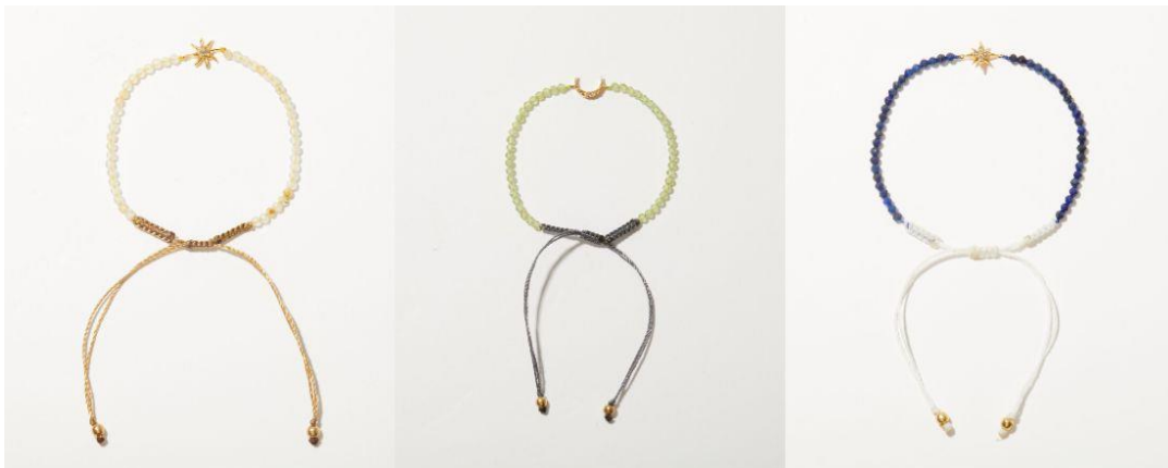
ルチルクォーツ／ペリドット／ラピスラズリ

bracelet 各5,500yen (with tax) 2023年6月1日（木）12:00発売予定