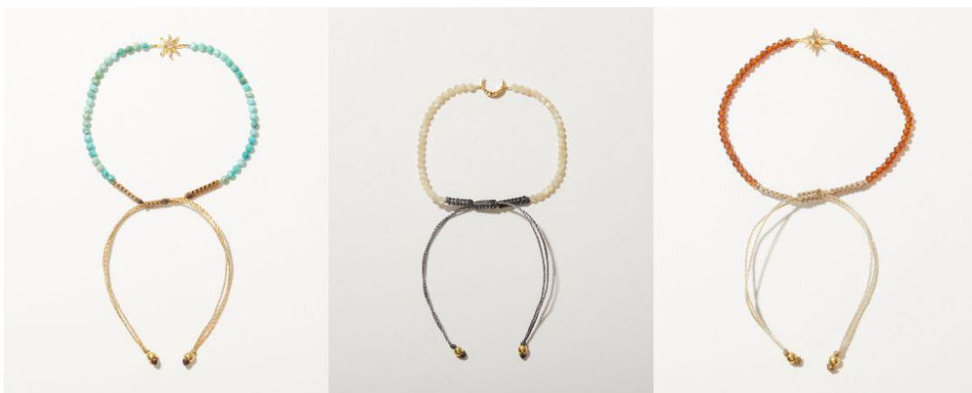
ターコイズ／マザーオブパール／ヘソナイト