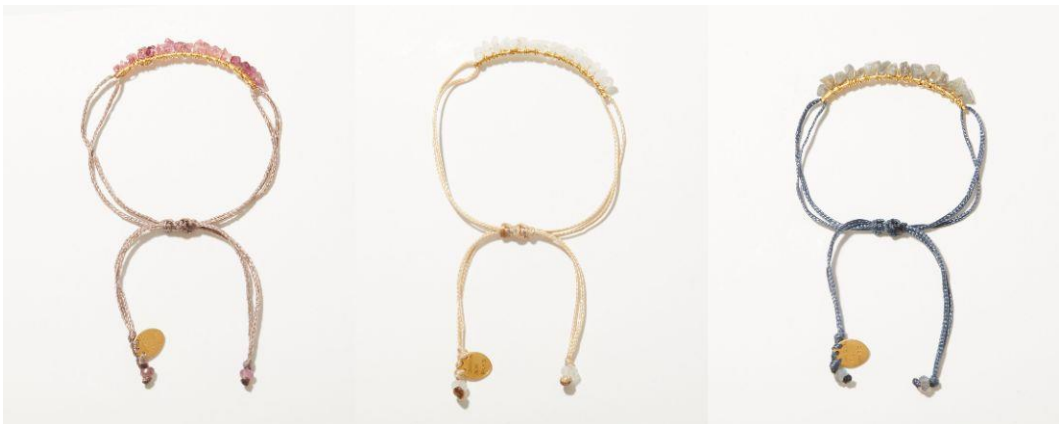
ラフカットの天然石をワイヤーに巻き付け、手首にフィットするアーチ状に仕上げたブレスレット。ピンクトルマリン、レインボームーンストーン、ラブラドライトの展開です。Bracelet 8,580yen (with tax)