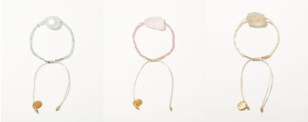
ラフカットのアクアマリン、ローズクォーツ、ルチルクォーツをアクセントに配した天然石ビーズのブレスレット。Bracelet 8,580yen (with tax)

コラボレーションジュエリーは、4月20日(木) 12:00より、VERMEIL par ienaと同時発売予定。