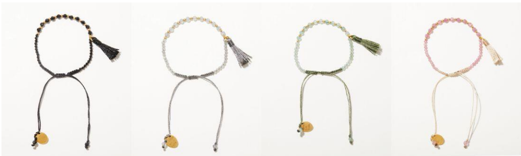
天然石ビーズに、MAISON N.H PARISのアイコンでもあるフリンジを添えたブレスレット。ブラックスピネル、ラブラドライト、アベンチュリン、ピンクトルマリンの展開です。Bracelet 7,480yen (with tax)