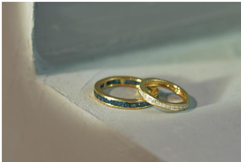
ブルーサファイア エタニティリング 75,900yen (with tax) / ダイヤモンドハーフエタニティ ピンキーリング 110,000yen (with tax)

感謝の気持ちを込めて、「THE ANOTHER MUSEUM」限定のエタニティリングをご用意しました。再入荷予定のない希少なジュエリーを集め、アーカイブジュエリーの展示販売も行います。