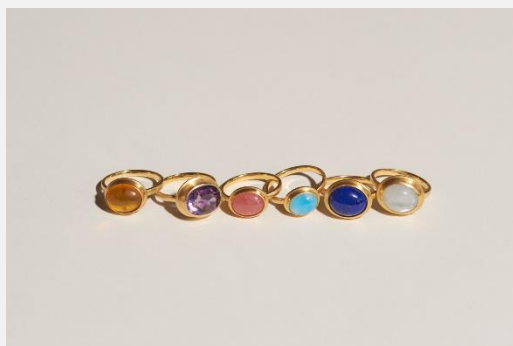
“ancient” cabochon step bezel ring / 15,400yen – 17,600yen (with tax)