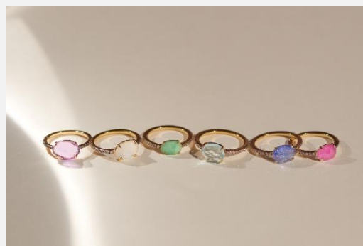
“elafonisi” pave diamond eternity ring / 28,600yen – 29,700yen (with tax)