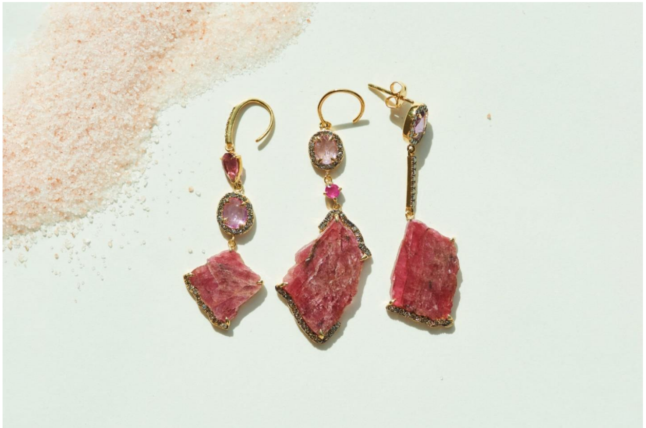
（左から）“kale” ロードクロサイト シングルピアス 28,600yen (with tax), 33,000yen (with tax) , 28,600yen (with tax)

世界中の女の子たちがジェンダーに基づく差別に苦しむことなく、輝ける日がくることを心より願います。