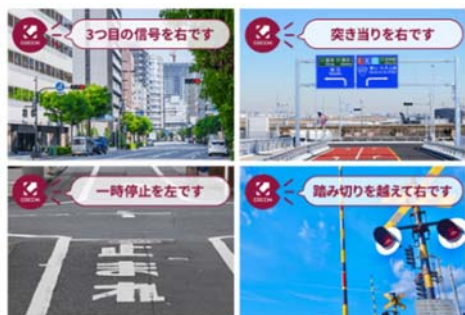
【分かりやすい音声案内】

「COCCHI」は、パイオニアがカーナビメーカーとして培ってきた技術やノウハウを活用したスマートフォン専用カーナビアプリです。運転中でも見やすい地図表示や、道路幅や信号の数、交差点の曲がりやすさまで考慮した質の高いルート探索、信号や踏切などを目印に適切なタイミングで発話する音声案内などの高精度なナビゲーション機能や、運転中の困りごとやトラブルをサポートする「ドライバーアシスト機能」を搭載しています。月額350円(税込)の基本プランは「Apple CarPlay」「Android Auto™」に対応しており、ディスプレイオーディオと連携できるほか、配送・送迎用途に便利な「住宅地図オプション」(月額1,050円/税込)を追加することもできます。