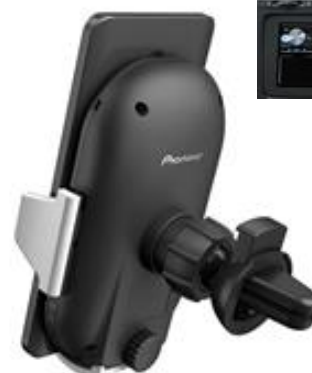
【エアコン吹き出し口取付アタッチメント】