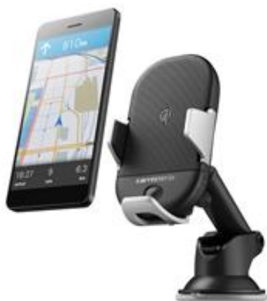
【オンダッシュ取付アタッチメント】

・奥行調節伸縮アーム付きオンダッシュ取付アタッチメントと、エアコン吹き出し口取付アタッチメントを同梱。