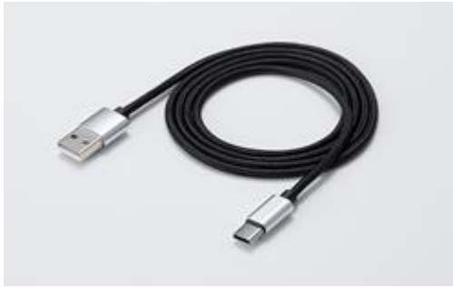
【USB Type-C ケーブル】

・車室内に持ち込みすぐ使えるUSB Type-CケーブルとQuick Charge 3.0対応シガーソケット用USBチャージャー(2系統)、吸着面取付シート、落下防止用ストラップを同梱。