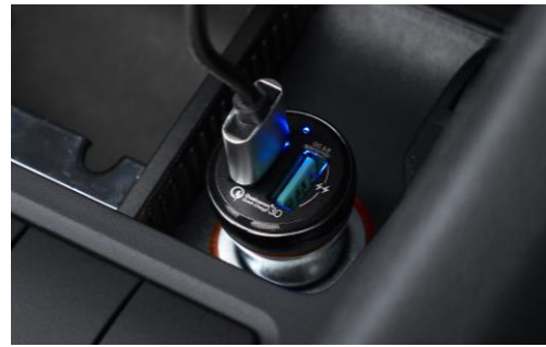
【シガーソケット用 USB チャージャー】