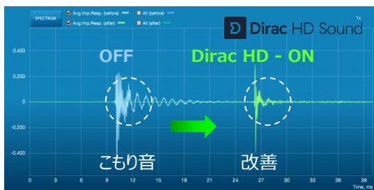
【Dirac HD Sound®を用いた、構造要因によるこもり音の低減】

パイオニア HP： http://pioneer.jp/biz/sound_solution/