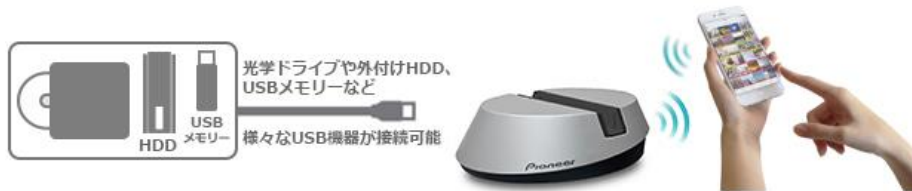
【「Wireless Photo Server ～Snap Pod～」接続イメージ】

また、既配信のミュージックアプリケーション「Wireless Hi-Res Player ～Stellanova～」(無料)をインストールした iPhone を使えば、本機に接続した光ディスクドライブ※2の CD から、ワイヤレスで楽曲取り込みや再生を行えるほか、HDD や USB メモリーなどへパソコンを介さずにワイヤレスで楽曲の移動やコピーを行うことができます。